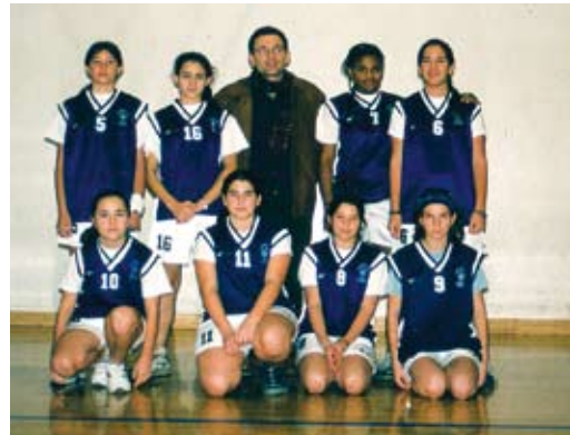
“Hay pocas actividades que ofrecer. El baloncesto nos ha venido bien.”

cadete femenino, preinfantil femenino, minibasket mixto, premini femenino y benjamín mixto.