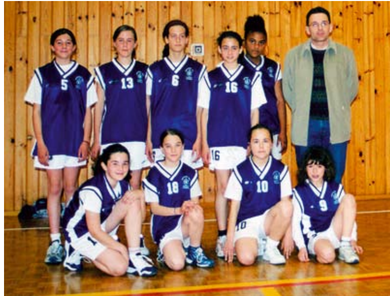
De un equipo en 2002 a siete en 2006

A partir de su creación, la progresión de Aranguren como club ha sido más que destacable. En su segunda temporada se forma un equipo de mini basket mixto con once chicas y tres