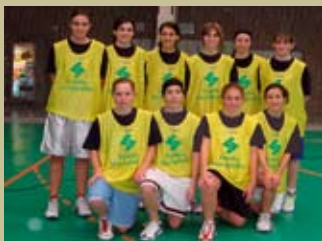
"Las carlitas" terceras clasificadas