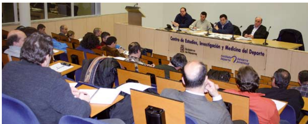
El arbitraje, motivo de preocupación

La Asamblea general de la F.N.B. se reunió, en sesión extraordinaria, el pasado 4 de febrero, con el fin de analizar la situación del colectivo arbitral en nuestra Comunidad.