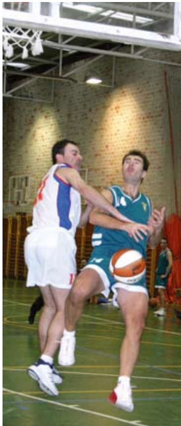
Anaitasuna y Mendialdea, lejos de la cabeza

Otros tres equipos navarros compiten en esta categoría. El mejor situado es el recién descendido Autocares Artieda, cuarto clasificado con catorce victorias y cuatro derrotas. Peor les marcha a La-maison, décimo; y a Fonseca Bus, decimoquinto con solo tres victorias.