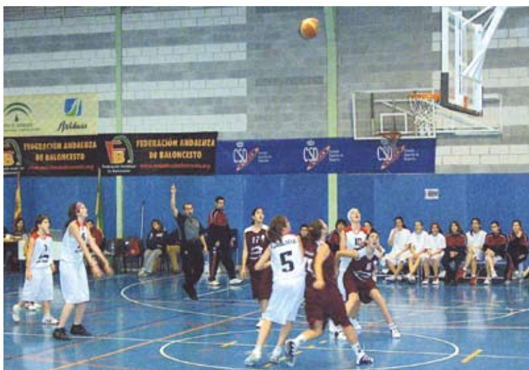
Las chicas de Eneko al rebote

No os podéis imaginar cuántas veces he visto en esta semana a alguien quejándose de algo que sucedía en el campeonato. Ni yo me podía imaginar que detrás de esa burbuja deportiva que aísla a jugadores y entrenadores hubiera tanto movimiento, tantas decisiones que tomar y discutir y tanta reunión invisible. Detrás de esa aparente normalidad que va del hotel al autobús, del autobús al polideportivo, del jugador al balón, al árbitro o al entrenador, de la pista otra vez al autobús y de vuelta al hotel... de esa incansable afición que viaja hasta el infinito para animar, de las muchas anécdotas del día, los amigos nuevos, las llamadas y los mensajes de móvil, esos chicos y chicas mayores tan guapos que pasan por delante de mi habitación, los reyes sin regalos ¿o no?... Detrás de