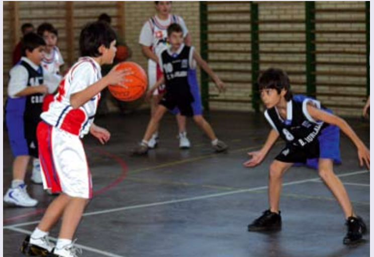
Larraona derrotó a Burlada en la primera fase

Las pasadas navidades acogieron, como viene siendo habitual, el torneo de navidad celebrado por el Club Baloncesto Maristas. Los días 23 y 24 de diciembre se pudo ver en acción a los más pequeños, tanto en categoría mixta como en femenina. En categoría mixta, el grupo "A" acogía a Maristas, Ardoi y Cantolagua. En el grupo "B"; Larraona, Burlada y Plaza de la Cruz. Al final, Larraona se hizo con el primer puesto, segundo fue Cantolagua y tercero Ardoi.