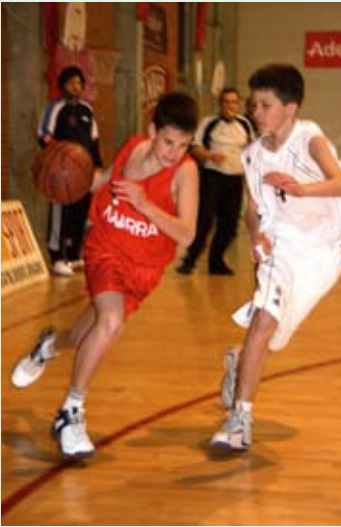
Navarra perdió con el Real Madrid

Las pasadas navidades también sirvieron para ver en acción a las selecciones minibasket tanto masculina como femenina. Los chicos participaron en el torneo Eomus en Zaragoza los días 28, 29 y 30 de diciembre. En este torneo participaban diversas selecciones, así como clubes de prestigio como el Real Madrid. El conjunto navarro superó la primera fase como segundo de grupo con dos victorias y una derrota. Sin embargo, tras superar los octavos de final, cae en cuartos con el Doctor Azúa. Finalmente, se hace con el séptimo puesto.