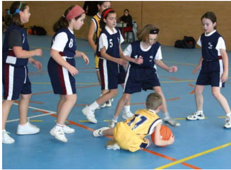
La Federación Navarra tiene más licencias femeninas que masculinas

Una vez pasada la primera fase en la categoría masculina, con el año nuevo ha llegado la fase de clasificación para los puestos del uno al ocho. Si bien por lo acontecido en los primeros meses de competición los favoritos para llegar a la Final Four eran Larraona, San Cernin, Ardoi y San Ignacio Natación; en las últimas jornadas Ega Pan ha presentado su candidatura. En categoría femenina, Larraona, Ardoi y Burlada han demostrado su potencial. Más emocionante está la lucha por la cuarta plaza, donde Bodegas Piedemonte, Ega Pan y San Ignacio tendrán sus opciones.