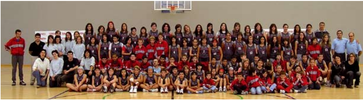
Foto de la presentación del Club Baloncesto Alsasua.

Volcados con la promoción del baloncesto en la Sakana