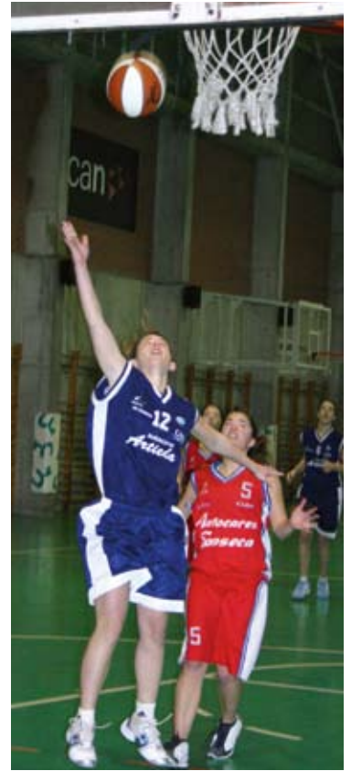
Autocares Artieda va cuarto

En la primera categoría, el liderato es para Ardoi, que suma trece victorias en quince encuentros. Su principal perseguidor es Burlada, situado sin embargo a tres victorias de los de Zizur. En segunda categoría, se llevan