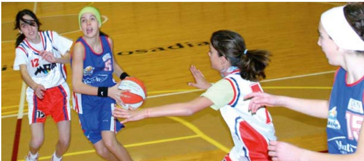
Partido muy disputado entre Ardoi y Larraona

En la categoría mixta, Burlada, Noáin Caja Rural, Maristas y Ardoi comandaron sus respectivos grupos al finalizar la primera fase. En cambio, la categoría femenina ya ha comenzado su fase final, en la que Teresianas - Txantrea, Burlada y Ardoi "B" suman una victoria.