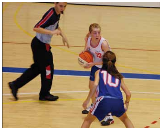
La final preinfantil femenino tuvo como protagonistas a Ardoi A y B