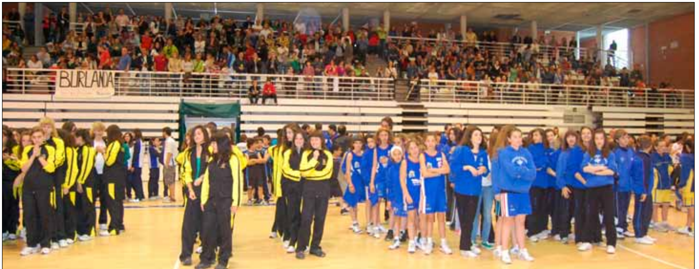
Los equipos preparados antes de la entrega de premios