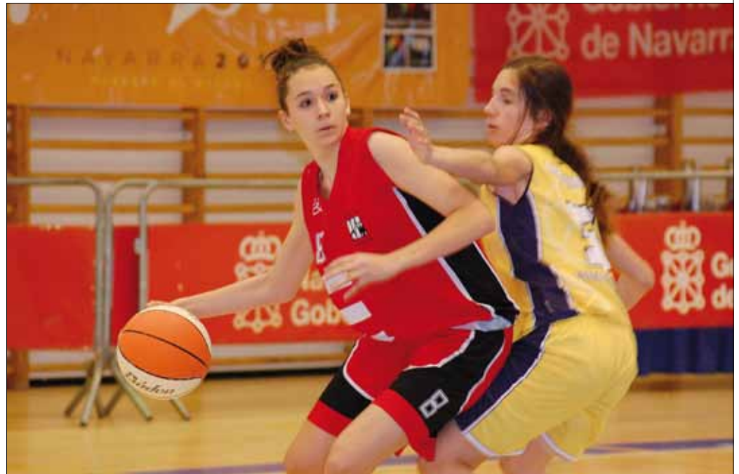
Partido Paz de Ziganda A Burlada y MB Solar Oncineda, final infantil femenina

Con las primeras plazas decididas en categoría preinfantil, llegaba el momento de dilucidar los campeones de categoría infantil. A diferencia de años anteriores, el sistema de competición cambió y en esta ocasión se eliminó el formato de final a cuatro para jugar una liguilla entre los equipos implicados. En el caso de categoría masculina, no hubo lugar para la sorpresa. San Cemin, Burlada y Aranguren Mutilbasket eran los rivales de San Ignacio, el principal rival a batir tras las fases previas. Pero pronto quedó todo prácticamente visto para sentencia, ya que Aranguren Mutilbasket, quien parecía ser el único capaz de plantar cara, cayó derrotado con San Cemin y sólo una cábala en