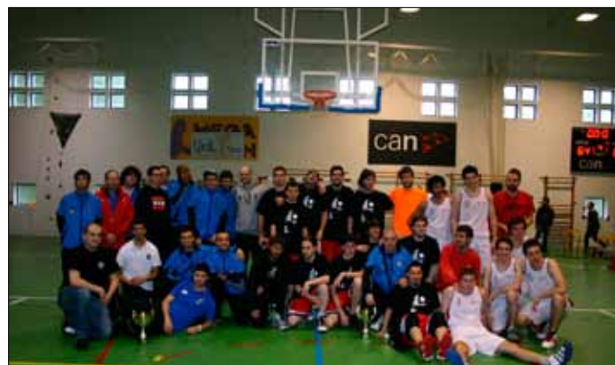
Los participantes de la final a cuatro de senior 1ª autonómica

ningún campeón revalidó su título, dando lugar a nuevas alternativas para el futuro.