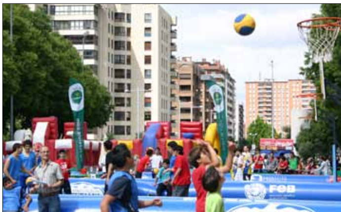
Antoniutti acogió la edición del pasado año

Nuevamente, el programa escolar de baloncesto llega el sábado 9 de junio a su máxima expresión con la celebración Campeonato Navarro de Baloncesto Escolar 3x3, enmarcado este año, en el circuito Plaza 2014 de la F.E.B., dentro del Streetball Ayto. de Pamplona.