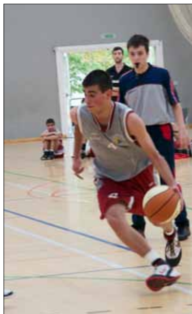
Arbitrando la final cadete de Alsasua