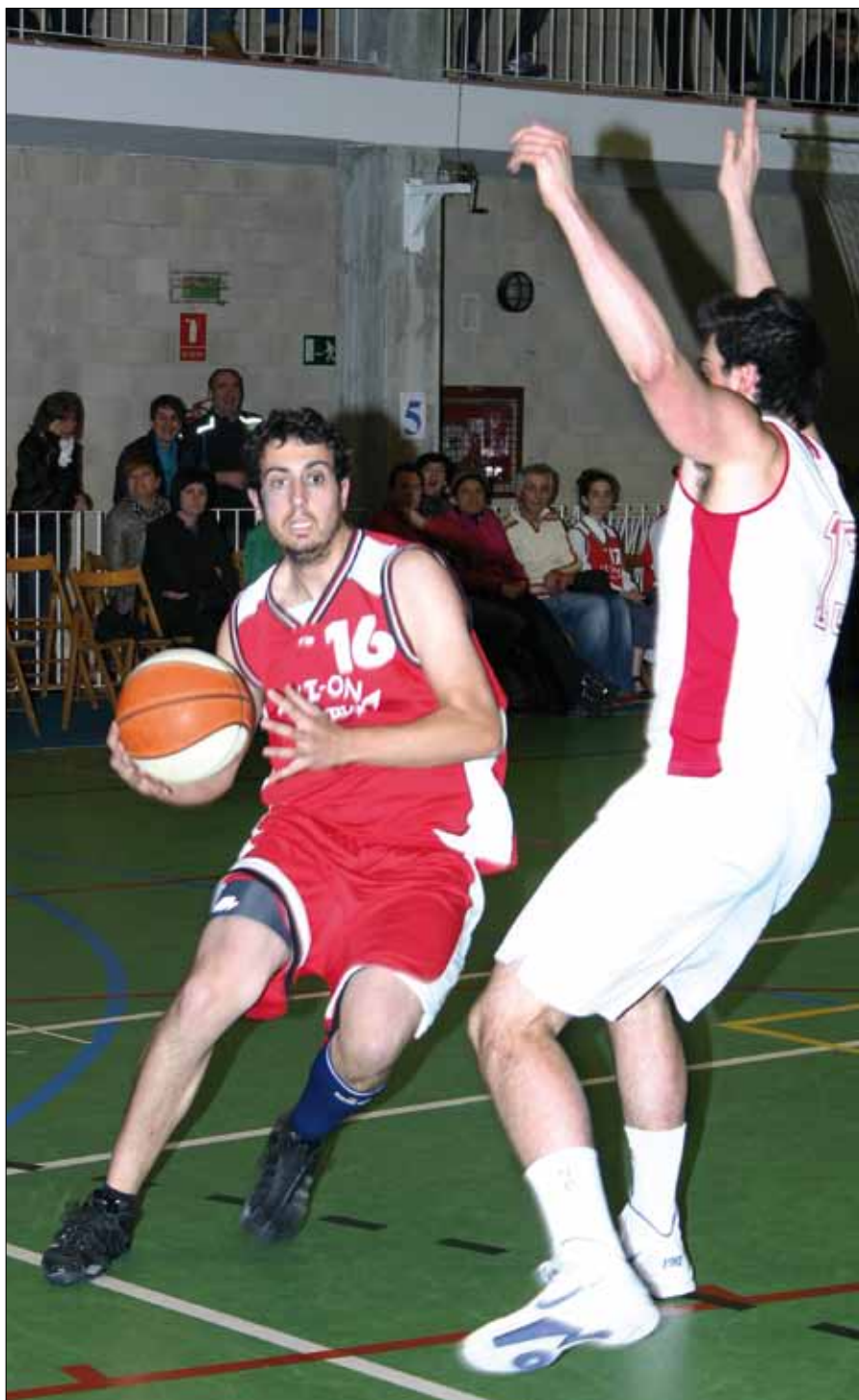
Final senior 1ª autonómica en Bera

En la final, pudo pasar de todo. A pesar de que parecía que San Jorge la había encauzado definitivamente, las anfitrionas tuvieron la oportunidad de darle la vuelta pero no se mostraron acertadas en los minutos finales. Esta circunstancia la aprovechó a la perfección San Jorge para llevarse el partido y proclamarse por fin campeón de la categoría (66-69).