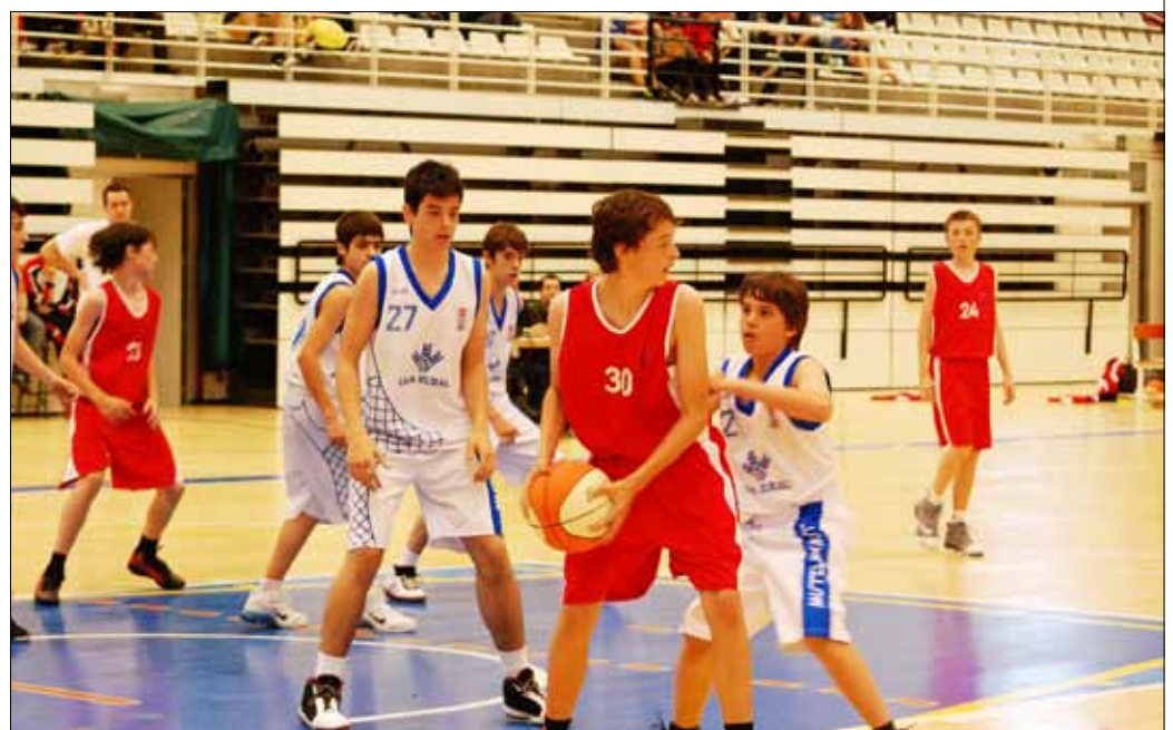
Partido Aranguren Mutilbasket y San Ignacio 98, final infantil masculina

la última jornada podía evitar que el título cayera en manos de San Ignacio. De esta forma, el partido final entre San Ignacio y Aranguren Mutilbasket fue de claro dominio para los primeros, que pronto encarrilaron el encuentro y se hicieron con el