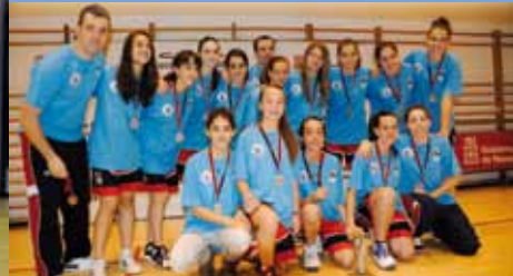
PAZ DE ZIGANDA BURLADA A