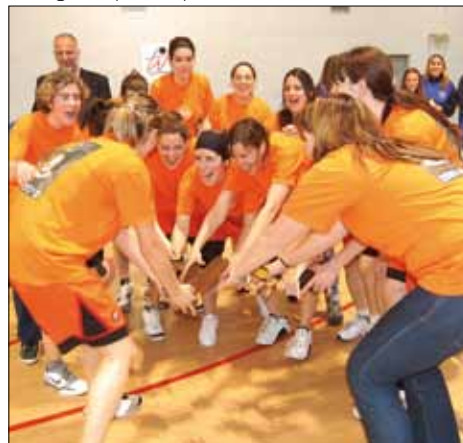
San Jorge celebra el título de campeonas