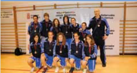
ARANGUREN MUTILBASKET AZUL