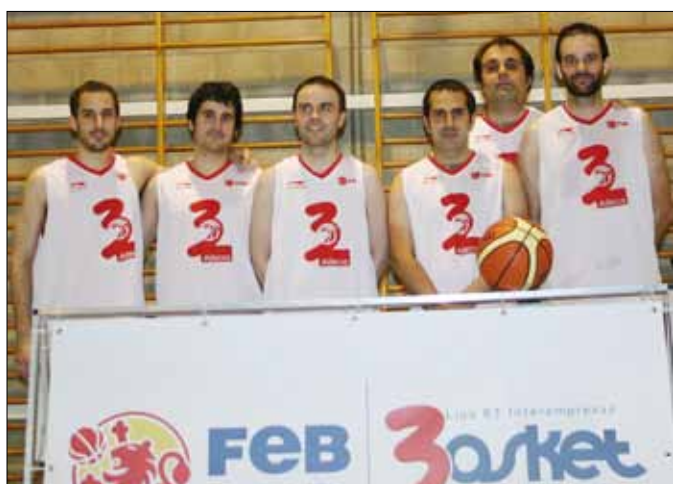
Peugeot Torregrosa, campeón de Liga y Copa

El pasado 19 de diciembre comenzó la primera edición de la Liga Adecco B3 Interempresas, una competición emocionante y divertida de baloncesto 3x3 en la que han participado los siguientes equipos: Acciona, Centro Comercial La Morea, Diario de Navarra, Diario de Noticias, Helphone, El Corte Inglés,