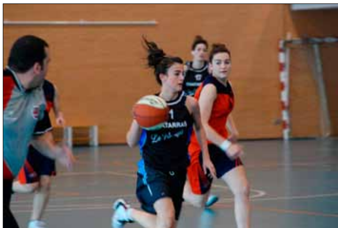
Encuentro entre Obenasa Liceo Monjardín y Burlada

categoría suponen la alerta definitiva en una nefasta temporada.