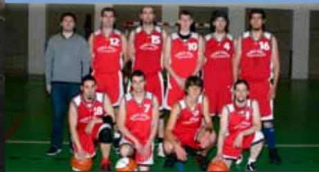
TOKI ONA BORTZIRIAK