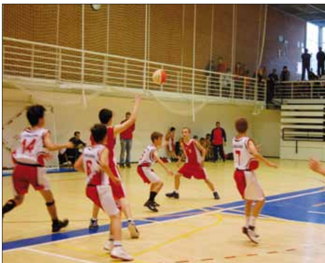
Larraona y San Ignacio disputaron la final de preinfantil masculino