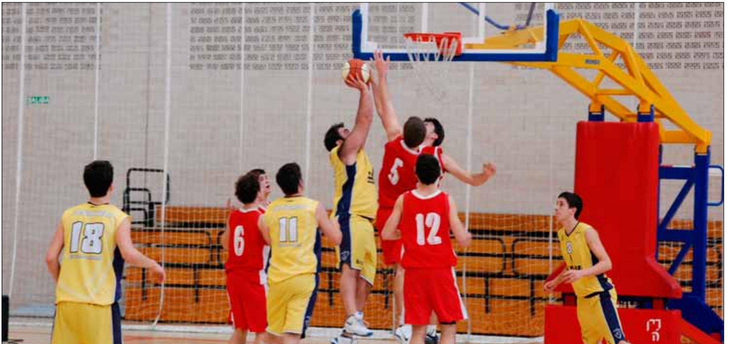
Ataque de Estación Servicio Vélaz Oncineda en la pista de San Ignacio UPNA

En primera división femenina, los equipos navarros tampoco brillaron como en otras épocas. El mejor clasificado terminó siendo Fundación Ardoi que finalizó séptimo a dos victorias del tercer clasificado. Las de Zizur mantuvieron una buena línea hasta la jornada 21, cuando se encontraban afianzadas en la tercera plaza. Sin embargo, después llegaron cinco derrotas que dejaron al equipo en una posición intrascendente. El siguiente mejor clasificado fue Burlada que, para tratarse de un recién ascendido, realizó una buena campaña eludiendo el descenso. San Ignacio UPNA también salvó el descenso de categoría, si bien le faltó durante la temporada encadenar alguna victoria más que, en momentos puntuales,