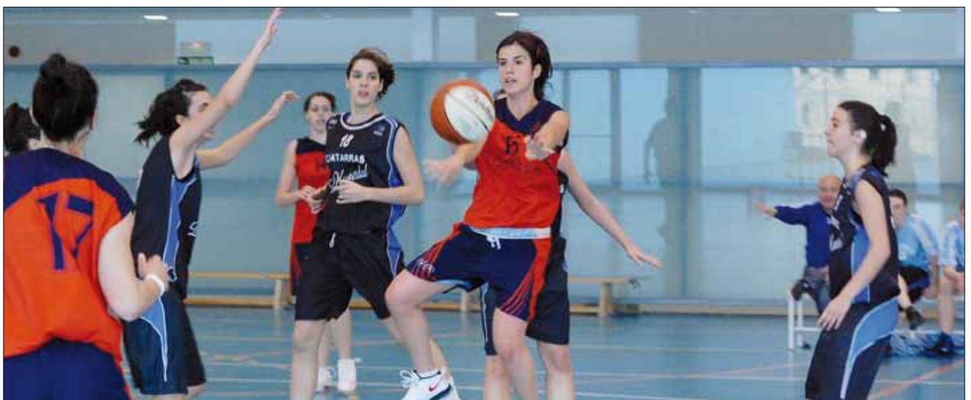
Un momento del derby entre Obenasa Liceo Monjardín y Burlada de 1ª división femenina

Por último, en segunda femenina, tan sólo Talleres Lamaison brilló en una categoría en la que seis de los quince participantes descendían. Con una regularidad tan exigente, el equipo de Estella respondió y salvó la categoría aunque no sin algunos apuros finales. No tuvo tanta suerte Autocares Artieda que, a pesar de rozar la salvación, terminó uniéndose a la nómina de equipos descendidos.