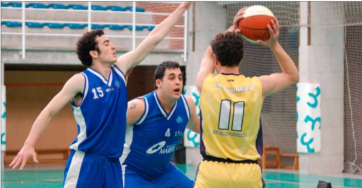
Encuentro entre Autocares Artieda San Cernin y Estación Servicio Vélaz Oncinada

El baloncesto navarro en categorías nacionales no vive su mejor momento. Cinco descensos de