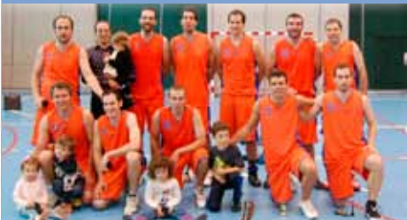
FONSECA A LICEO MONJARDIN