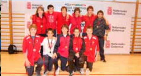
SAN IGNACIO 98