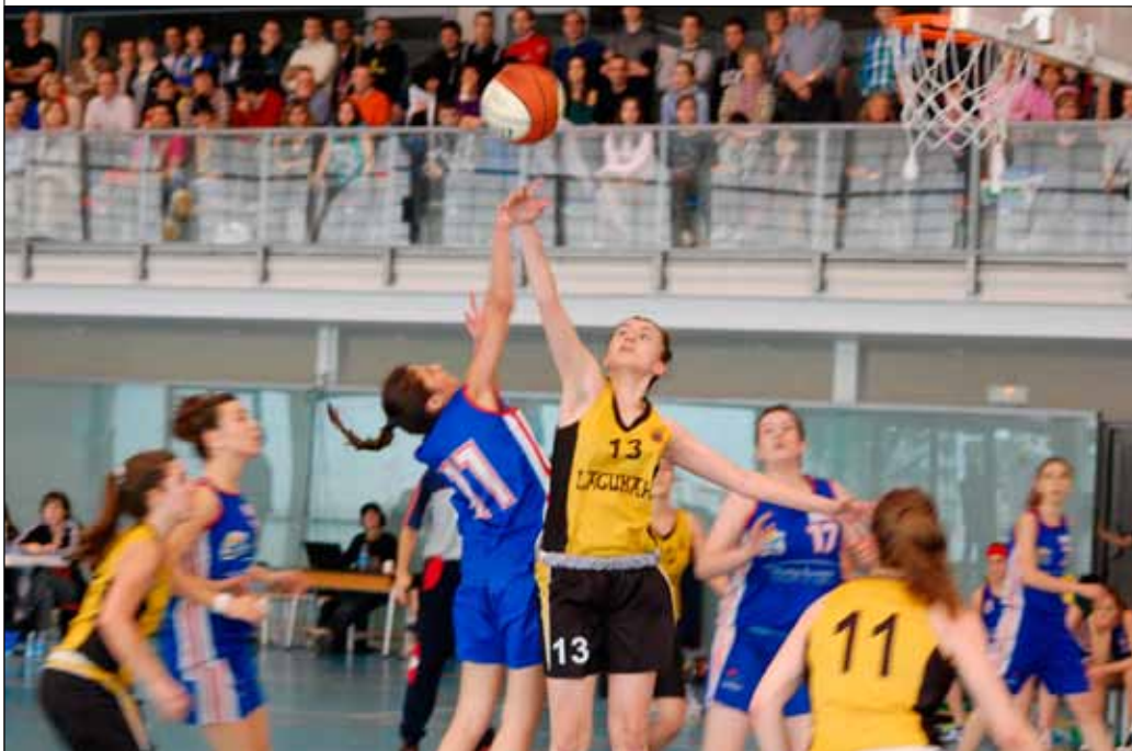
Disputa del rebote en la final femenina

Los resultados de liga regular les colocaban como máximos aspirantes a llevarse el título de liga y Burlada y Ardoi no defraudaron. La primera final en disputarse fue la masculina, que Alsasua acogió el 13 de mayo. Los locales dieron el primer paso más difícil, colarse en la final tras derrotar con sufrimiento a San Ignacio por 63-58. Burlada, en cambio, no encontró rival en el Arenas de Tudela, al que terminó superando por 81-56.