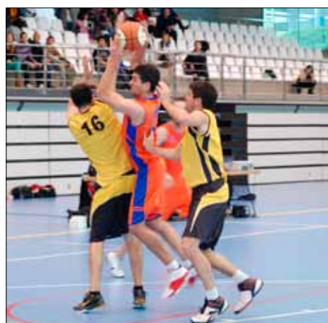
Final 2ª división interautonómica