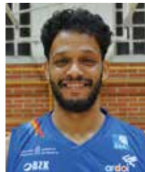
Chej Ainatu Alero 4ª temporada