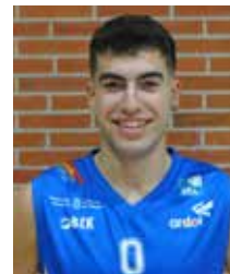
Pau Elso Ala-Pívot 1ª temporada