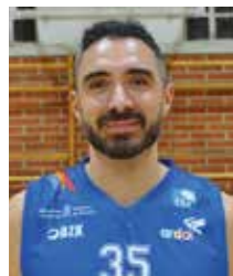
Pope Urtaşun Alero 7ª temporada