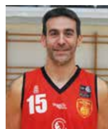
Iñaki Narros Alero 12ª temporada