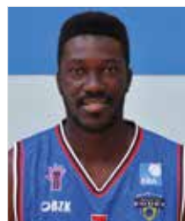
Serge Konan Ala-Pívot 5ª temporada